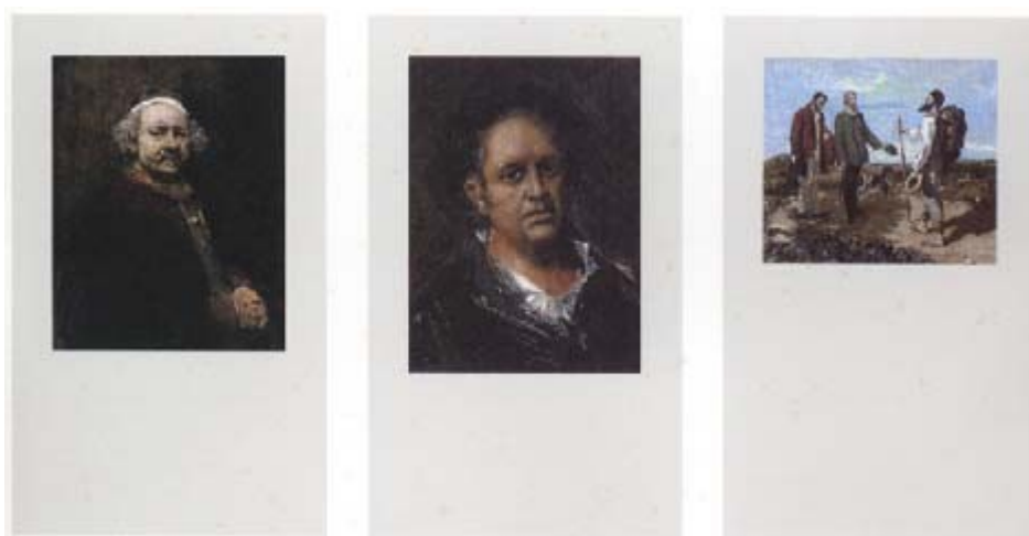
Fig. 3a : Gérard Collin-Thiébaud, Un Nouveau Musée Clandestin à Strasbourg , 1988. Image 4 « Rembrandt van Rijn, Autoportrait , 1669, National Gallery, Londres », Image 5 « Francisco Goya, Autoportrait , vers 1815, Musée du Prado, Madrid » et Image 6 « Gustave Courbet, Bonjour Monsieur Courbet , 1854, Musée Fabre, Montpellier ». Trois des Images diffusées par les gardiens du musée lors de l'exposition collective Saturne en Europe , organisée par les musées de Strasbourg du 16 septembre au 4 décembre 1988. 4,1 x 7,1 cm. 1600 ex. par Image, gratuit. Existents 200 planches des 12 Images (1-12p), un tirage spécial de 50 ex. sans la mention d'Édition des Musées de la Ville de Strasbourg (1A-12A) et un autre tirage de 50 ex. par Éric Linard, La Garde-Adhémar (1B-12B). Clara Wood édition-diffusion, Vuillafans.

À cette fin, ils ont dû adapter les exigences des systèmes économiques du marché de l'art. L'exemple le plus emblématique de cette tendance est celui de l'instauration de deux pratiques de collections parallèles, dans le cadre des Images de Gérard Collin-Thiébaud conçues sur des supports de communication de grande diffusion depuis 1988. La multiplication excessive des tirages spécifiques et des conditions tarifaires des Images, leur association répétée à d'autres éditions au cours d'interventions artistiques parfois très élaborées, conduisent à un mode d'existence multiple de l'œuvre (fig. 3 a, b). De ce fait, les artistes parviennent à offrir divers moyens d'accès. Non seulement la vente d'éditions limitées et chères facilite la production d'éditions plus accessibles mais encore leur diversification à outrance fausse l'appropriation individualisée et raréfiatrice du collectionneur. Ce système fonctionne d'autant mieux si le coût de l'édition est pris en charge par un organisme public ou un mécène.