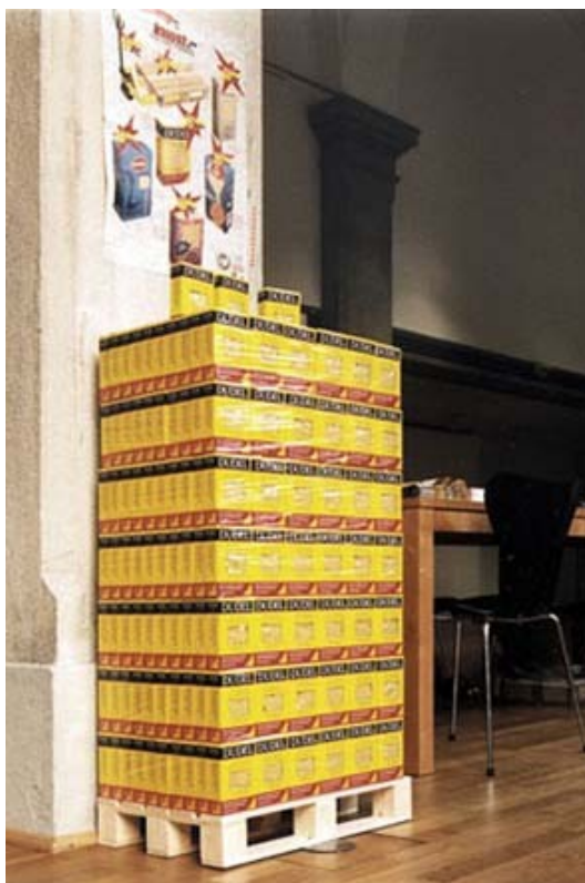
Fig. 7a : Alexander C. Totter, ACT Babylon , 1998- . Boîtes de « Dudel » (2000) empilées sur une palette et exposées à la Literaturhaus de Munich. 13 x 8,6 x 3,3 cm (boîte). 10 000 ex., signés, numérotés, à 15 euros (boîte). Artakut, Paderborn ; Artikel Editionen, München.

Enfin, quatrième et dernier résultat : la mise en place par les artistes dans le cadre de leur pratique de modèles d'économies alternatives – néanmoins inspirés de la réalité. Depuis les années 1990, beaucoup d'œuvres s'apparentent à des produits issus d'unités de production à vocation commerciale créées par des artistes. Lorsqu'en 1998, Alexander C. Totter a mis en place sa pseudo-société A.C.T. Babylon , il a conçu divers objets s'inspirant de la grande distribution et du discours publicitaire mais dont l'émergence et la diffusion s'établissaient au sein de réseaux artistiques. Pour preuve, la boîte « Dudel » de l'artiste, qui a fait l'objet d'une grande diffusion à bas prix chez les éditeurs et les galeristes (fig. 7 a, b). La prise en charge par l'éditeur a permis une diffusion plus élargie qu'elle ne l'aurait été sans assistance et dans un cadre a fortiori marginal.