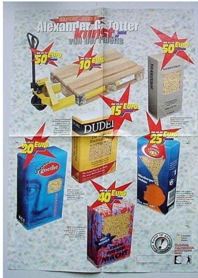
Fig. 7b : Affiche détaillant l'ensemble des produits d'ACT, disponible chez Artakut à Paderborn. 59,2 x 42 cm (dépliée). Tirage indéterminé, gratuit. Artakut, Paderborn.

Les productions artisanales peuvent être abordables, même diffusées par le biais de structures artistiques, et un grand tirage, rendu possible grâce à la fabrication à la demande. L'art tente donc de s'ouvrir à une autre réalité sociale – l'entreprise – sans jamais pouvoir ni vouloir entièrement s'y insérer. Néanmoins, ce compromis, qui est avant tout un moyen de montrer les systèmes d'entreprise, autorise la production en un nombre relativement important d'objets à bas prix. Sans parvenir à industrialiser leur production, les artistes sont allés au-delà des contraintes du mode artisanal imposé, en inscrivant leurs œuvres au sein d'un marché plus global bien que dépendant de celui de l'art.