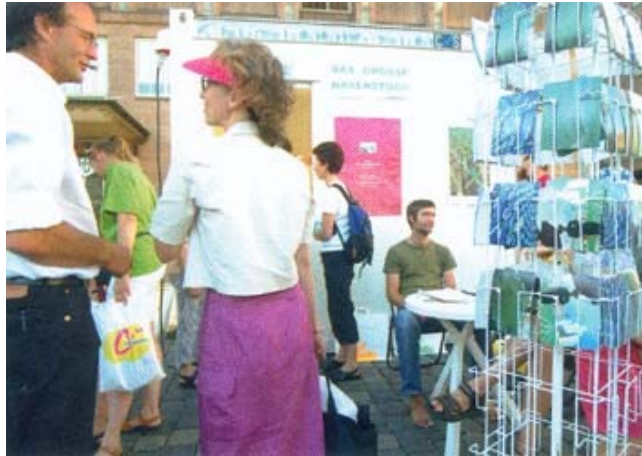
Fig. 1c : Ottmar Hörl, Das große Hasenstück , 2003. Vue du stand d'information à côté de la « grande sculpture » Das große Hasenstück (Nuremberg 2003). Proposition à la vente de cartes postales, affiches et distribution d'affiches et flyers assortis produits par la ville (disponibles aussi dans ses institutions). © Avec l'aimable autorisation d'Ottmar Hörl, Photo: archive Ottmar Hörl ; Maisenbacher Art Gallery, Trier.

En général, ce type de dispositif favorise la médiatisation de ces éditions et leur vulgarisation. Les artistes déclinent au sein de leurs projets non seulement des objets mais aussi des imprimés, souvent à mi-chemin entre le prospectus publicitaire et le document pédagogique. À l'image du projet FremdeFreunde de Manfred Webel conçu en collaboration avec des écoliers de la ville de Siegen en 2001, les éditions permettent la communication et la conservation de la trace d'une intervention initiale, récupérée par l'artiste voire ses co-participants (fig. 2 a, b, c). Les multiples et « autres » multiples sont de moins en moins des œuvres autonomes diffusées par leurs auteurs ou éditeurs et s'inscrivent dans le cadre d'une œuvre ouverte, difficilement limitable. Ils deviennent le moyen d'atteindre un grand nombre de personnes dont les attentes sont diverses.