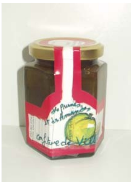
Fig. 5b : Fabrice Hybert, Confiture de ville 2 , 2001. Pot de 220g de confiture de prune aux amandes, vendu au rayon peinture lors de l'exposition Le BHV inspire les artistes (Paris 2001). 8,7 h. x 6,8 cm diam. Tirage indéterminé, à 25 francs (3,81 euros). Édition limitée, à 20 euros. UR éditions, Paris. © Avec l'aimable autorisation de Fabrice Hybert.