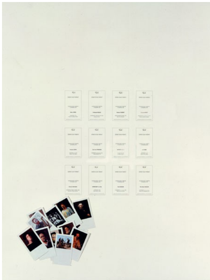
Fig. 3b : Gérard Collin-Thiébaud, Un Nouveau Musée Clandestin , 1989. Tirage spécifique 1B-12B. Planche sérigraphiée avec douze vignettes. 65 x 50 cm. 50 ex., à 305 euros. Éric Linard, La Garde-Adhémar. © Avec l'aimable autorisation de Éric Linard et de Gérard Collin-Thiébaud, G ©-T 1988. Photo G. C-T. 1989.