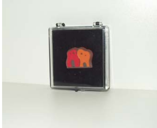
Fig. 2b : Manfred Webel, FremdeFreunde Anstecker , 2001. Épinglette dans écriin, représentant les deux figures du projet FremdeFreunde . Édition vendue sur le site Internet de l'artiste http://www.webel.org , par correspondance ou à Artakut Kunstprojekte, 6,7 x 5,9 x 1,9 cm (écriin). 1000 ex., à 9 euros. Édition de l'artiste, Paderborn.