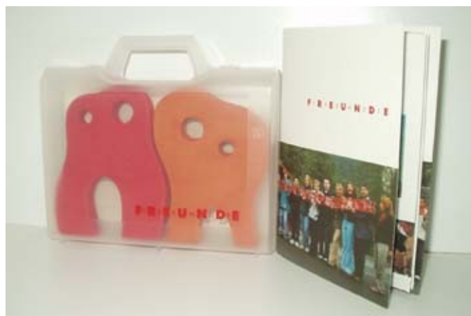
Fig. 2a : Manfred Webel, FremdeFreunde-Koffer , 2001. Valise en plastique incluant deux figures faites à la main, formant une chaîne avec les figures identiques des autres valises, et une brochure sur le projet FremdeFreunde . Édition vendue comme « documentation » sur le site de l'artiste http://www.webel.org , par correspondance ou à Artakut Kunstprojekte, Paderborn. 16 x 14 x 4 cm (valise). 500 ex., à 17 euros. Édition de l'artiste, Paderborn. © Avec l'aimable autorisation de Manfred Webel.

En général, ce type de dispositif favorise la médiatisation de ces éditions et leur vulgarisation. Les artistes déclinent au sein de leurs projets non seulement des objets mais aussi des imprimés, souvent à mi-chemin entre le prospectus publicitaire et le document pédagogique. À l'image du projet FremdeFreunde de Manfred Webel conçu en collaboration avec des écoliers de la ville de Siegen en 2001, les éditions permettent la communication et la conservation de la trace d'une intervention initiale, récupérée par l'artiste voire ses co-participants (fig. 2 a, b, c). Les multiples et « autres » multiples sont de moins en moins des œuvres autonomes diffusées par leurs auteurs ou éditeurs et s'inscrivent dans le cadre d'une œuvre ouverte, difficilement limitable. Ils deviennent le moyen d'atteindre un grand nombre de personnes dont les attentes sont diverses.