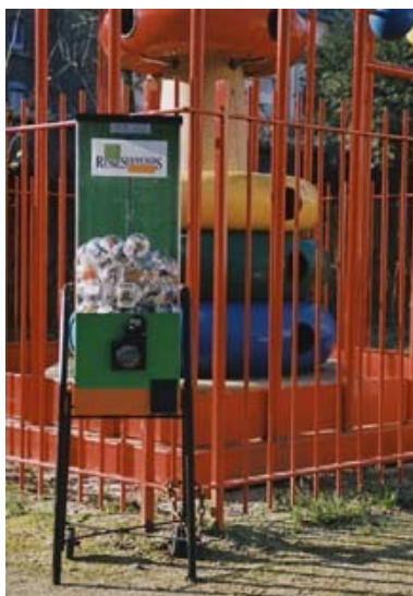
Fig. 6a : Markus Lohmann, RenneSouvenirs , 2001. Distributeur de « boules souvenirs » de l'artiste lors de l'exposition collective Aux Voyageurs du 13 au 28 janvier 2001 à Rennes. © Avec l'aimable autorisation de Markus Lohmann.

Enfin, l'espace public extérieur offre des possibilités d'accès non marginales dès lors que les interventions urbaines d'artistes s'inscrivent dans le contexte d'une exposition. Ainsi, les boules miniatures de l'intervention Rennes Souvenirs de Markus Lohmann, distribuées dans la rue au cours de l'exposition collective Aux Voyageurs à Rennes en 2001, ont fait l'objet de communiqués non seulement dans le cadre de l'exposition mais aussi au sein de l'œuvre plus globale de l'artiste (fig. 6 a, b).