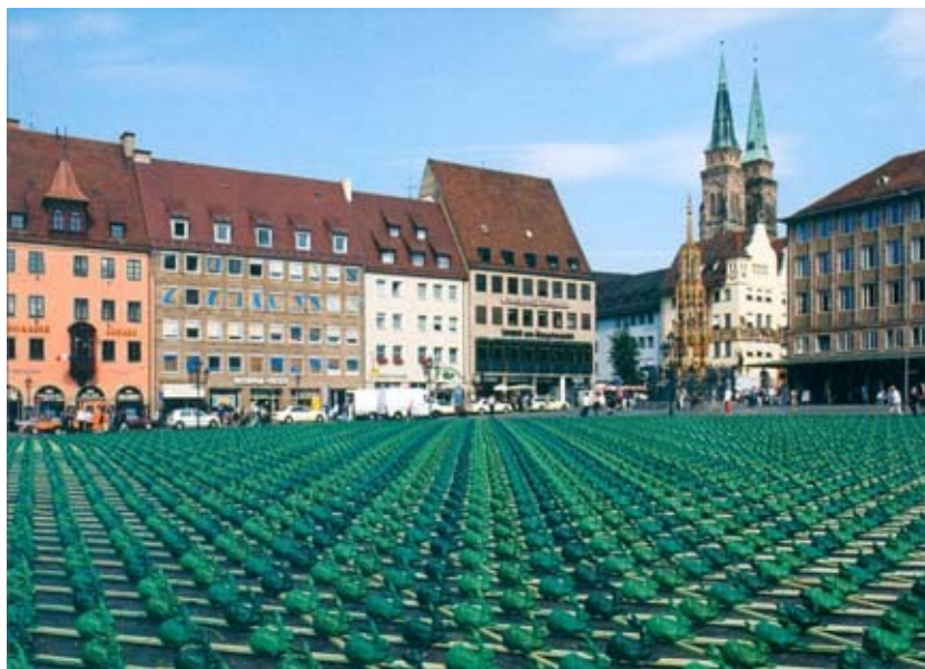
Fig. 1a : Ottmar Hörl, Das große Hasenstück , 2003. Carte postale issue d'une série disponible au stand d'information installé à côté de la « grande sculpture » Das große Hasenstück sur la place principale de Nuremberg du 2 au 17 août 2003. 10,4 x 14,8 cm. 2000 ex., à 0,50 euro. Projektbüro, Nürnberg. Vue de l'installation temporaire des 7000 lièvres en plastique verts. 50 x 50 m. © Avec l'aimable autorisation d'Ottmar Hörl. Photo: archive Ottmar Hörl ; Maisenbacher Art Gallery, Trier.