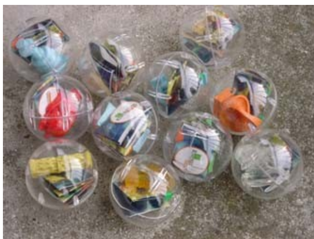
Fig. 6b : Markus Lohmann, RenneSouvenirs , 2001. Dix « boules souvenirs » se rapportant aux dix sculptures de commande publique de Rennes et distributeurs placés à leur côté lors de l'exposition Aux Voyageurs (Rennes 2001). 6,8 cm diam. (boule). 722 pièces uniques (dix séries différentes), à 10 francs (1,5 euro). Édition de l'artiste, Hambourg.