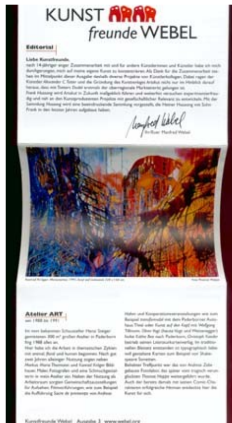
Fig. 2c : Manfred Webel, Kunstfreunde Webel , Ausgabe 3, Juli 2002. Périodique, sous forme de dépliant, disponible à Artakut Kunstprojekte, Paderborn. 10,5 x 15 cm (plié). 1000 ex., gratuit. Édition de l'artiste, Paderborn. © Avec l'aimable autorisation de Manfred Webel.