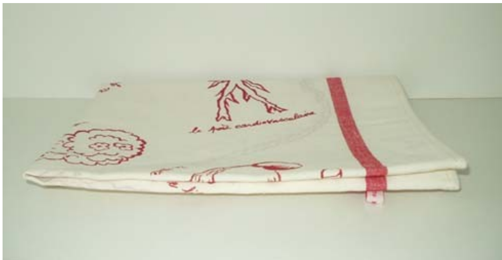
Fig. 5a : Annette Messenger, Torchon digestif , 2001. Torchon en coton et en lin vendu au rayon des poignées de porte lors de l'exposition collective Le BHV inspire les artistes dans le grand magasin parisien du 28 février au 24 mars 2001. Existe en deux couleurs (impression rouge ou bleue sur blanc). 80 x 54 cm (déplié). Tirage indéterminé. Édition de l'artiste, Paris. © Avec l'aimable autorisation de Annette Messenger.

Il en va de même pour la vente de multiples à la clientèle importante des magasins, à l'instar de la Confiture de ville 2 de Fabrice Hybert et le Torchon digestif d'Annette Messenger lors de l'exposition Le BHV inspire les artistes au Bazar de l'Hôtel de Ville à Paris, début 2001 (fig. 5 a, b).